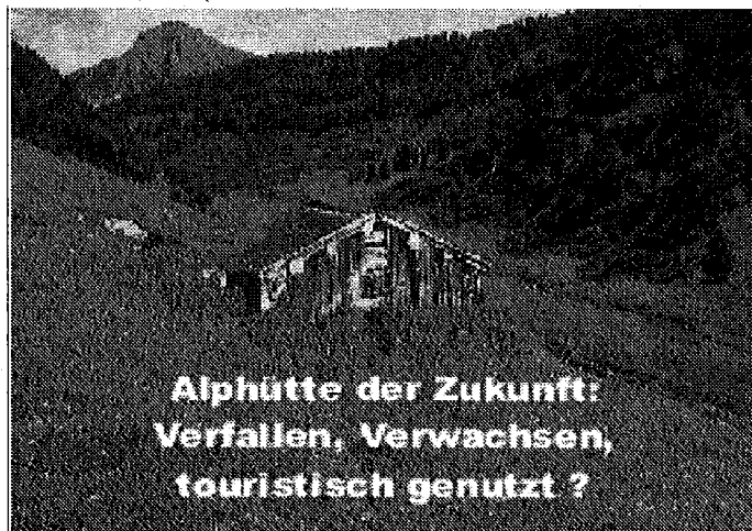
Alphütte der Zukunft: Verfallen, Verwachsen, touristisch genutzt?

Der methodische Zugang ist übrigens auch bei anderen Fragestellungen mit vertretbarem Aufwand möglich und beschränkt sich nicht auf die Kulturlandschaftsforschung.